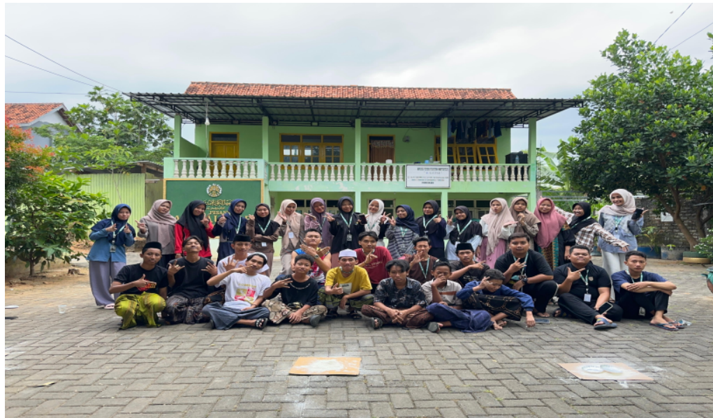
Gambar 2 Outbond

Tahap ke dua Setelah data terkumpul, dilakukan pendekatan dengan santri melalui kegiatan outbound . Tujuan dari kegiatan ini adalah untuk membangun kepercayaan, membentuk kelekatan emosional antar peserta, serta membuka ruang komunikasi yang lebih santai dan menyenangkan. Permainan yang digunakan dalam kegiatan outbound bersifat kolaboratif, seperti: lompat kardus berkelompok, memasukkan sedotan dalam botol, dan gilir tepung. Kegiatan ini bertujuan mencairkan suasana dan menciptakan kedekatan emosional sebagai landasan untuk tahap expressive writing .