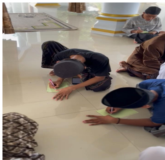
Gambar 3 Layanan klasikal

Tahap ketiga yaitu tindakan. Pada tahap ini dilakukan layanan klasikal dalam bentuk sesi expressive writing yang dipandu oleh fasilitator. Santri diajak menuliskan pengalaman, perasaan, dan pikiran mereka dalam bentuk tulisan bebas. Sesi ini dilanjutkan dengan berbagi pengalaman secara sukarela dalam refleksi bersama. Tujuan utamanya adalah membantu santri menyalurkan emosi dan membangun kesadaran diri melalui ekspresi tertulis.