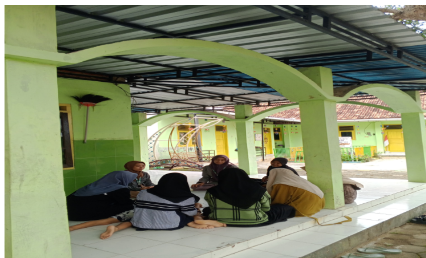
Gambar 1. Wawancara

Kegiatan dilaksanakan selama tiga hari secara bertahap, yaitu: observasi, pendekatan dan tindakan. Tahap pertama yaitu observasi dilakukan dengan tujuan untuk mengidentifikasi sejauh mana perasaan kesepian ( loneliness ) dialami oleh para santri. Metode yang digunakan adalah wawancara semi-terstruktur yang dilakukan secara langsung kepada beberapa santri sebagai responden. Wawancara semi terstruktur ( in-depth interview ) juga dikenal sebagai wawancara mendalam, adalah proses mendapatkan informasi tentang tujuan penelitian melalui tanya jawab secara langsung antara pewawancara dan orang yang diwawancarai, atau tanpa menggunakan pedoman wawancara. Dalam wawancara ini, pewawancara dan informan terlibat dalam hubungan sosial yang relatif lama. (Ardiansyah et, al, 2023) Pertanyaan wawancara mencakup: perasaan ketika berada di pondok, hubungan dengan teman sebaya, aktivitas sehari-hari, momen-momen ketika merasa sendiri atau tidak dimengerti. Hasil dari observasi ini digunakan sebagai dasar dalam merancang pendekatan dan tindakan selanjutnya yang lebih tepat sasaran.